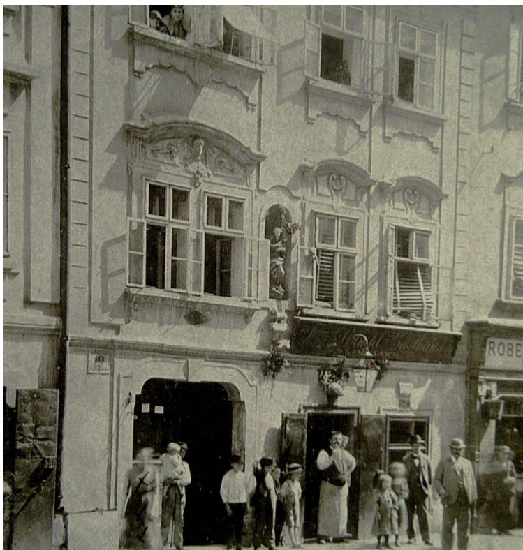
Abb. 23b. Die Windmühlgasse. Häuser Nr. 19 (Gasthaus) bis Nr. 29 in Schrägsicht. Ausschnitt Haus Nr. 19 („Zum Lamm“).

Das vorliegende Foto zeigt die Aufschrift „Ferdinand Rumpl Gasthaus“. Darunter ist sehr klein „ZUM LAMM“ zu lesen.