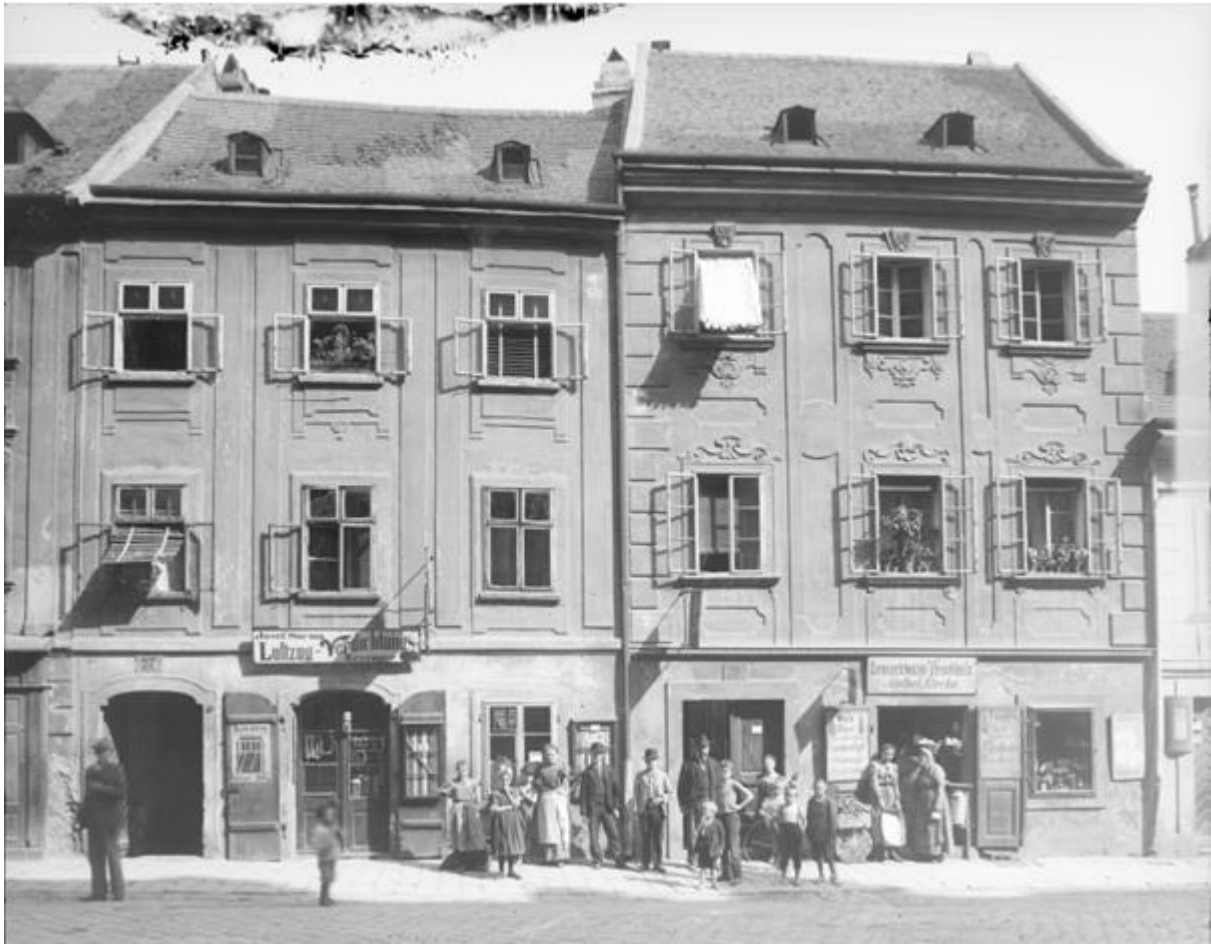
Abb. 32. „Wien 6, Windmühlgasse 27/29“. Frontalaufnahme vor dem Umbau. Autor August Stauda, Glasplatte, 1899 / Inv.-Nr. ST 259F / ÖNB / online: http://www.bildarchivaustria.at/Preview/2896574.jpg (Zugriff: 4.6.2019) [2]