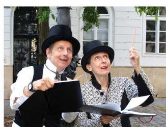
Das Josefstädter Schreib-Duo